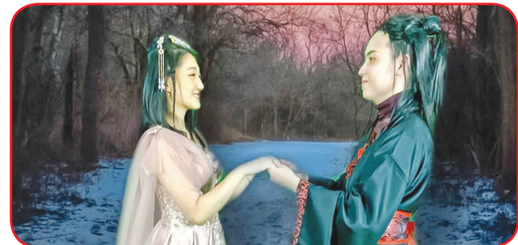
Adegan Penggembala Sapi dan Gadis Penenun.