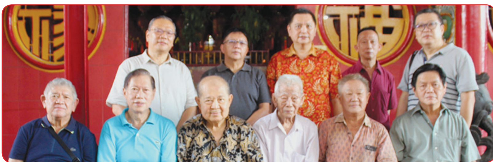
Jajaran pengurus Yayasan Santoso berfoto bersama.

JAKARTA (IM) - Yayasan Santoso menggelar bakti sosial dengan membagikan 1.500 paket bahan kebutuhan pokok (beras dan lainnya) kepada warga atau umat yang tidak mampu di sekitar Vihara Dharma Sakti, Petak Sembilan, Jakarta Barat, Sabtu (11/9). Mengingat masih dalam suasana PPKM, pembagian sembako dilakukan dengan protokol yang ketat dan pembagian waktu. Sebelumnya, Yayasan Santoso juga telah menggelar Sembahyang "Cioko / Ulambana", dipimpin oleh Maha Bhiksu Duttavira Sthavira atau yang akrab disapa Suhu Benny, dilakukan juga dengan protokol yang ketat hanya pengurus dan undangan khusus yang dapat mengikuti dan