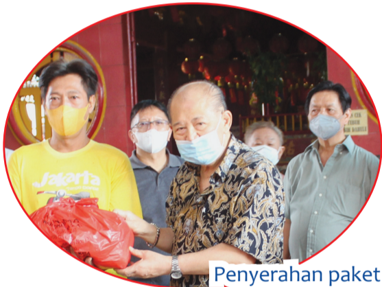
Penyerahan paket sembako ke warga.