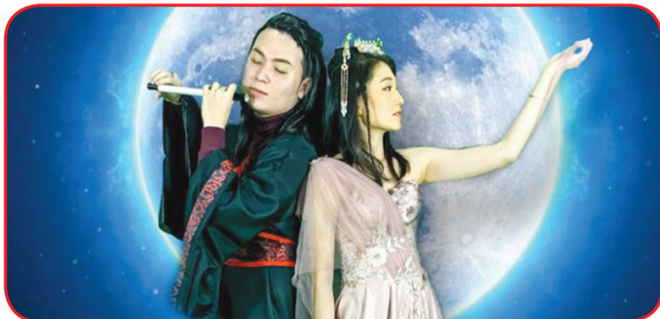
Adegan Penggembala Sapi dan Gadis Penenun.