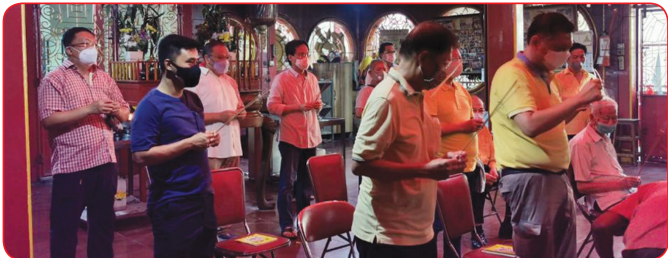
Prosesi sembahyang Cioko/Ulambana.

JAKARTA (IM) - Yayasan Santoso menggelar bakti sosial dengan membagikan 1.500 paket bahan kebutuhan pokok (beras dan lainnya) kepada warga atau umat yang tidak mampu di sekitar Vihara Dharma Sakti, Petak Sembilan, Jakarta Barat, Sabtu (11/9). Mengingat masih dalam suasana PPKM, pembagian sembako dilakukan dengan protokol yang ketat dan pembagian waktu. Sebelumnya, Yayasan Santoso juga telah menggelar Sembahyang "Cioko / Ulambana", dipimpin oleh Maha Bhiksu Duttavira Sthavira atau yang akrab disapa Suhu Benny, dilakukan juga dengan protokol yang ketat hanya pengurus dan undangan khusus yang dapat mengikuti dan