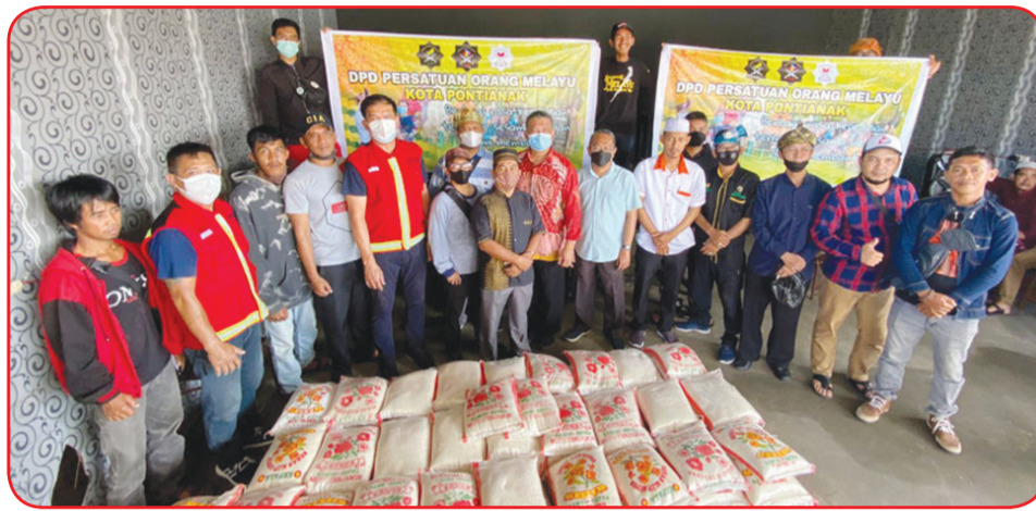
Panitia Gerakan Donasi Sembako Pontianak berfoto bersama dengan pengurus POM Kota Pontianak.

Sugianto yang akrab disapa Rico ini berharap kebaikan