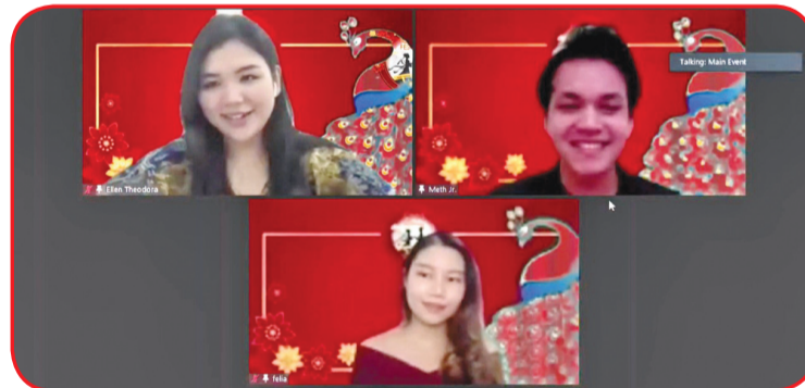
Prosesi perayaan Qixi Festival.