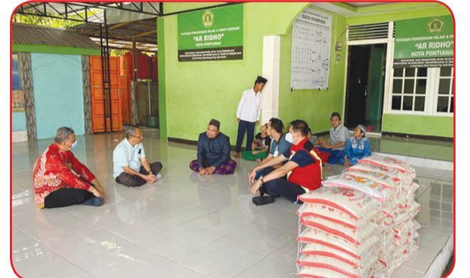
Panitia Gerakan Donasi Sembako Pontianak bersama pimpinan Panti Asuhan Ar Ridho Pontianak berbincang di selasar panti asuhan.

Selain itu, bantuan beras juga menyalur ke panti seperti kepada Panti Asuhan Hieronimus, Panti Werdha Marie Joseph dan lain sebagainya. Bantuan juga menyalur Kumpai Raya, Desa Sungai Ambang, Kabupaten Kubu Raya. • idn/din